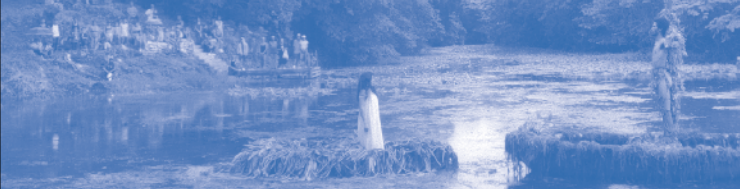
Los océanos son los verdaderos continentes

Black Box Kino im Filmmuseum Düsseldorf Schulstraße 4 · 40213 Düsseldorf Tel. 0211.899-2232 www.duesseldorf.de/filmmuseum